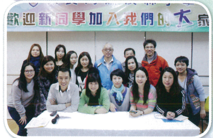
家教會第十一屆委員合照