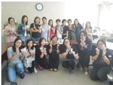
✚ 16 名家長親手製作七彩潤唇膏